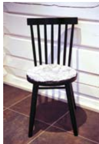
Köksstolarna har smarta "sittdynor" av runda fårskinnsbitar.