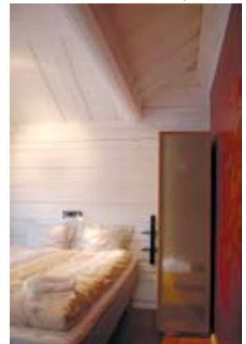
Innertaket följer yttertaket's vinklar. Det är klätt med vildmarkspanel.