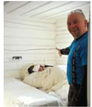
Siste man blir bryskt väckt för fotografering.

— Jag ville att man skulle få en upplevelse av att komma in i huset. Om folk tycker om huset är de också rädda om det.