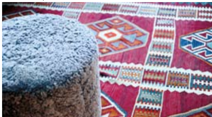
Tina har intretts huset med få och smakfulla detaljer: