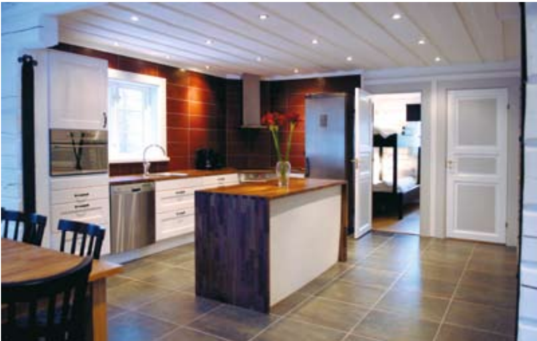
Kök, hall och vardagsrum har en öppen planlösning så att många kan umgås på den nedre våningen samtidigt.

klar, rören drogs i stockarna. Vi har bara tilläggsisolering i köket och badrummet, eftersom huset är byggt i 8 tums timmer och inte behöver tilläggsisoleras överallt.